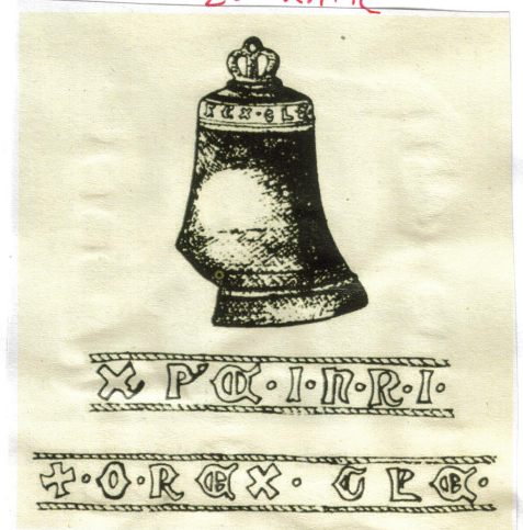
Zvornik: Kasnogotičko zvono

Crkvu sv. Marije i franjevački samostan u Zvorniku Bartol Pizanski bilježi u Mačvanskoj kustodiji kao "locum Sanctae Mariae de Campo (Campanili)". Grad se, po zvoniku franjevačkog samostana, u srednjem vijeku zvao Zvonik (Zonicurn, Zuonich, Suonivh). Godine 1426. Petroje Ilić ostavio je crkvi sv. Marije u Zvorniku mali vinograd na Kozjem brdu i konja sa sedlom, a da franjevci za njega održe gregorijanske mise; godine 1454. Paoko Stipašina Brajkovića ostavlja 15 dukata; godine 1478. jedan Dubrovčanin ostavlja srebrni križ od 7 dukata. Grad je pao pod Osmanlije 1462., a 1533. godine samostan je napušten i crkva pretvorena u džamiju. Gonzaga 1587. godine bilježi: "Civitas (Suonich) ab Illyricis nuncupata."