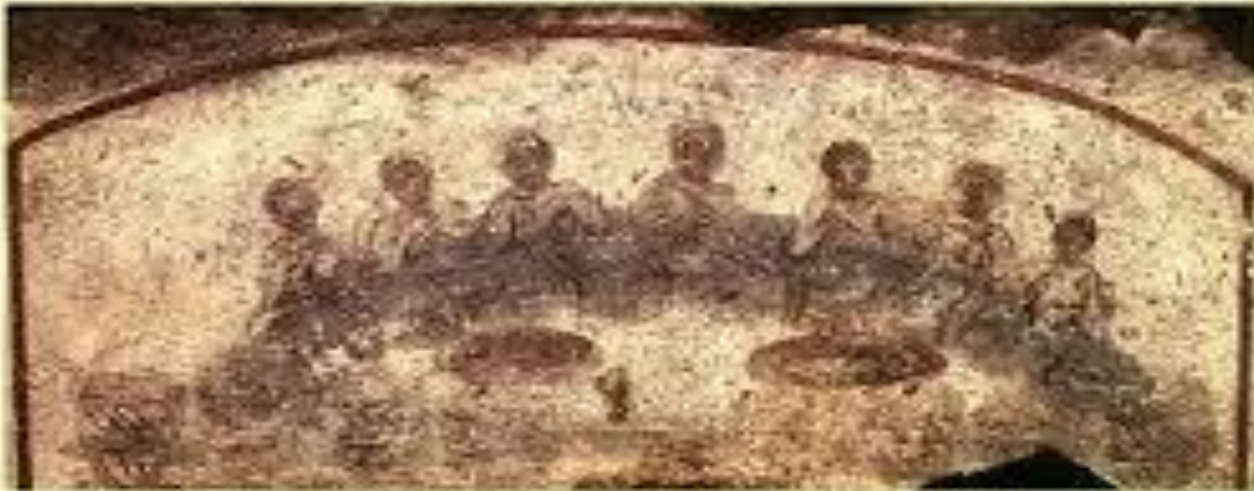
Posljednja večera, freska iz katakombe sv. Kalista (San Callisto) u Rimu, 3. st.

Osim Očenaša zajednica nema neku konkretnu molitvenu „formulu“, već je molitva prepuštena spontanosti kako zajednice, tako i njezina sabiratelja. Više možemo govoriti o „književnoj vrsti“ molitve koji se polako rađa na tim sastancima i iz kojega će onda (iza apostolskog vremena) polako formulirati pojedini obrasci molitve, vezani osobito za kršćanski sastanak. U prvoj zajednici molitva proizlazi iz doživljaja i iskustva vjere kao o određenih konkretnih situacija koje toga trenutka proživljava. Pogledajmo barem u kratkim crtama Djela apostolska: