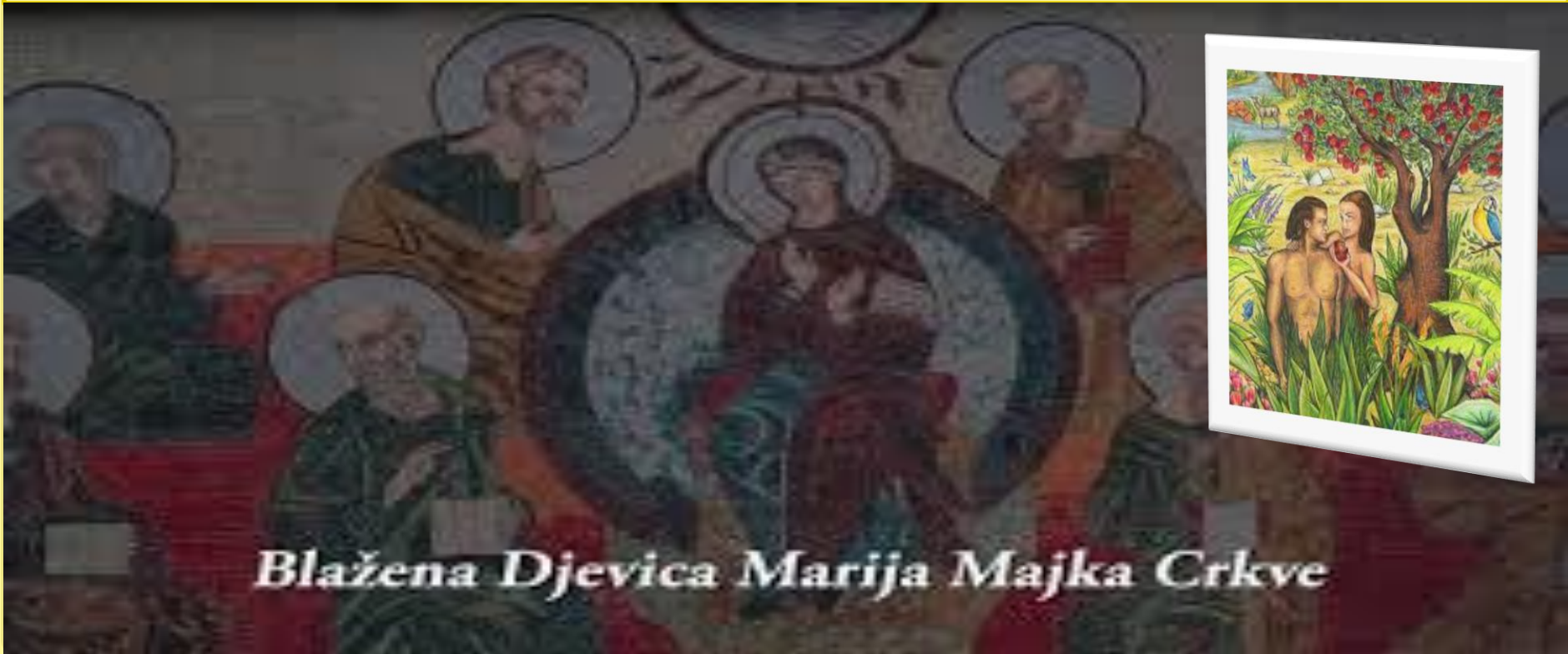
Blažena Djeвица Marija Majka Crkve

To je čas rađanja Crkve. Kao nekoć Adam i Eva pod stablom dobra i zla, tako sad stoji uz stablo križa novi Adam i nova Eva, Isus i Marija. Prvi par je grijehom upropastio ljudski rod, drugi ga par otkupljuje i spašava. Ispunja se proročanstvo koje je sadržano u samom imenu Eve. Marija je doista majka živih - to naime znači Eva – jer je svojim „da” pristala na porođajne muke Božje djece. Ivan je pravo njezino dijete, a da u tom pogledu ne bi bilo nikakve sumnje, Isus to i nazivom očituje. S pravom Crkva vidi u ovim riječima potvrdu za istinu da je Marija suotkupiteljica ljudi i majka Crkve. Marija i Crkva tvore novu obitelj.